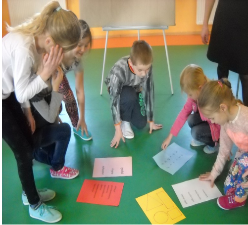
Etyka-Profilaktyka wśród najmłodszych. Grudzień 2014