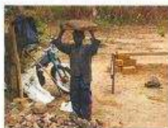
Młody chłopak pomagający przy budowie kaplicy