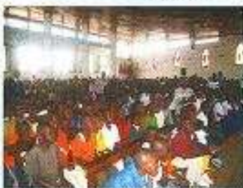
Niedzielną Mszę Św. w jednej z Parafii w Brezsville