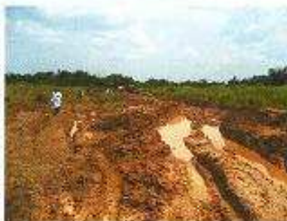
Tak w Afryce w porze deszczowej często wyglądają drogi poza miastem

Będąc w Brazylii trudno się sportem nie interesować, ponieważ Brazylijczycy nim żyją. Piłka nożna jest dla nich sportem narodowym. Podobnie zresztą jest we Włoszech, gdzie trzeba komuś kibicować. Nie można być „normalnym” człowiekiem, jeśli się jakiegś drużynie nie kibicuje. Dla księdza jest to o tyle trudne, że kibicując jednej drużynie, naraża się kibicom innej drużyny, więc czasem trochę trzeba lawirować z tym kibicowaniem.