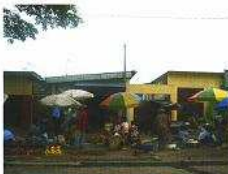
Uliczny handel w Brazzaville (handluje się wszystkim)